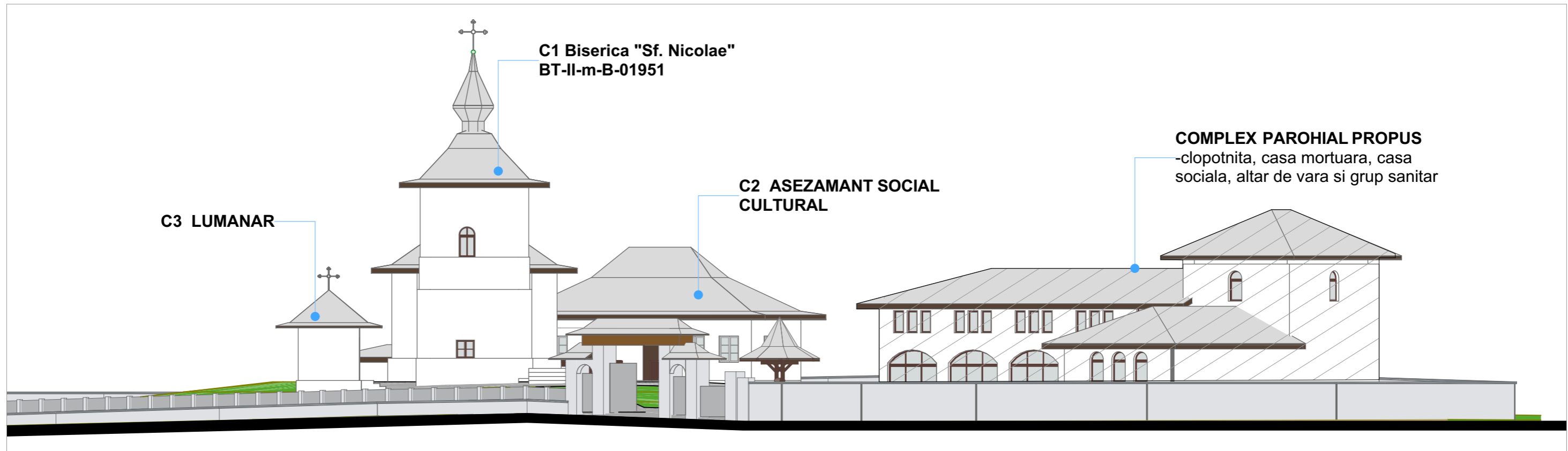
DESFAȘURARE STRADA SF. NICOLAE